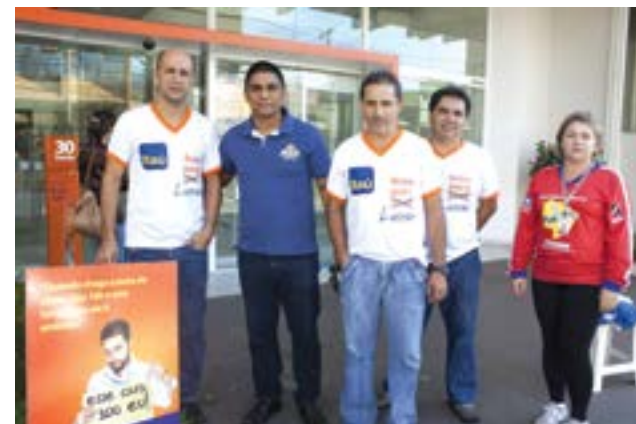
Contra assédio moral, bancários paralisam agência do Itaú em Campo Grande