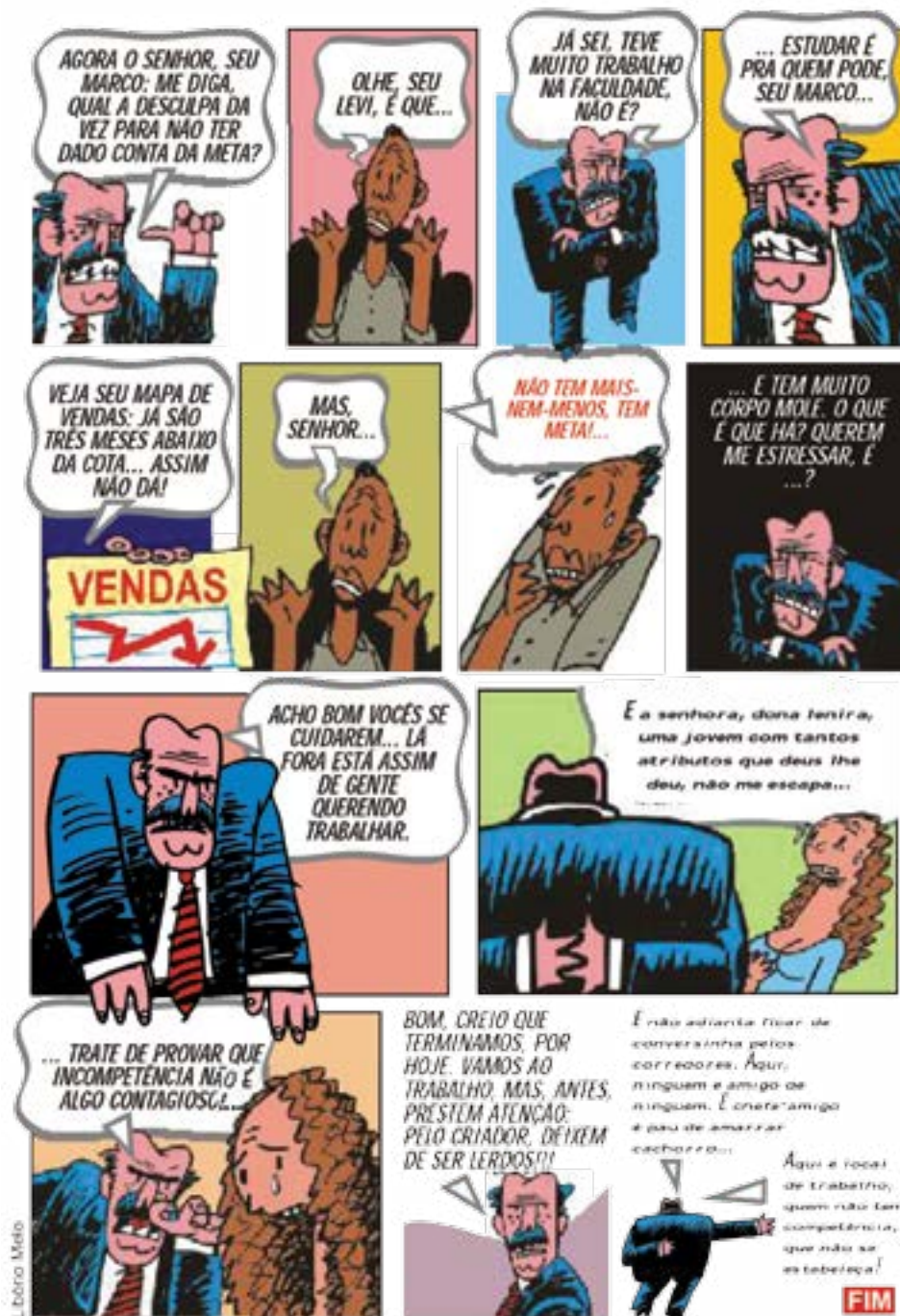
TIRAS E ILUSTRAÇÕES: CNB-CUT-FETEC-NE - FEDERAÇÕES E SINDICATOS

assumido nesta quarta-feira 24 por representantes da direção do Itaú perante o Sindicato de Campo Grande de que vão procurar solucionar o problema de assédio moral praticado pela gerente da unidade, os bancários da agência Personalité da capital sul-matogrossense decidiram retornar ao trabalho nesta quinta 25, após três dias de paralisações, enquanto aguardam as providências do banco.