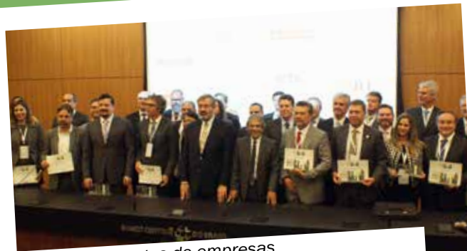
Representantes de empresas premiadas no "Empresa Pró-Ética 2016"