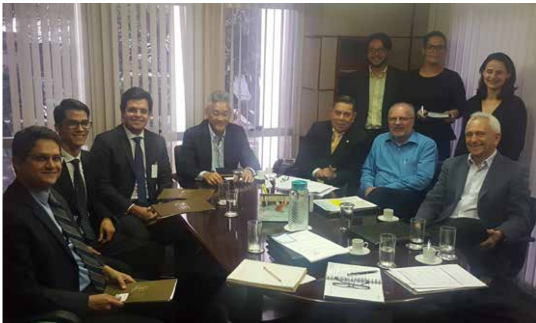
Diretoria da ANABB avaliou com advogados as implicações da decisão do STF e as opções a serem oferecidas aos associados

de 60 anos continuam na ativa. Já o percentual de mulheres nessa condição sobe para 55,5%. Os dados integram o livro Política Nacional do Idoso: velhas e novas questões , lançado recentemente pela entidade. A complementação de renda está entre os motivos para os idosos permanecerem em atividade.