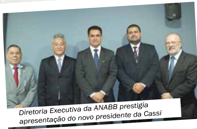
Diretoria Executiva da ANABB prestigia apresentação do novo presidente da Cassi

Pessoas com doença de Alzheimer podem ter isenção de IR nos proventos de aposentadoria, reforma ou pensão. Apesar de o Alzheimer não estar listado no rol de enfermidades previsto na Lei nº 7.713/1988 para isenção do IR, tem sido enquadrado no grupo de alienações mentais. O paciente ou representante legal precisa procurar o órgão pagador da aposentadoria ou pensão, como o INSS, com a documentação exigida pela Receita. Para tanto, é necessária a comprovação da doença por laudo pericial emitido por serviço médico oficial, constando a designação “alienação mental” e a classificação correspondente (CID). As informações completas estão no site www.receita.fazenda.gov.br . Em caso de dúvidas, os associados da ANABB podem buscar o serviço de Orientação Jurídica da Associação, pelos telefones 0800 023 1542 (de telefones fixos) e (21) 3883 5650 ou pelo e-mail anabb@hugojerke.com.br .