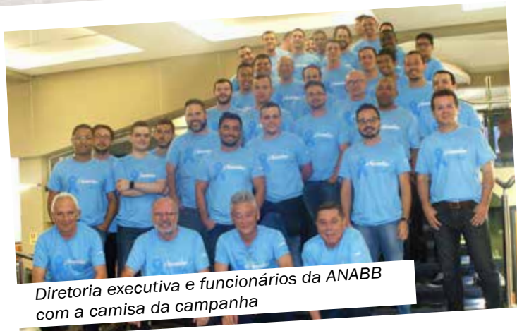
Diretoria executiva e funcionários da ANABB com a camisa da campanha