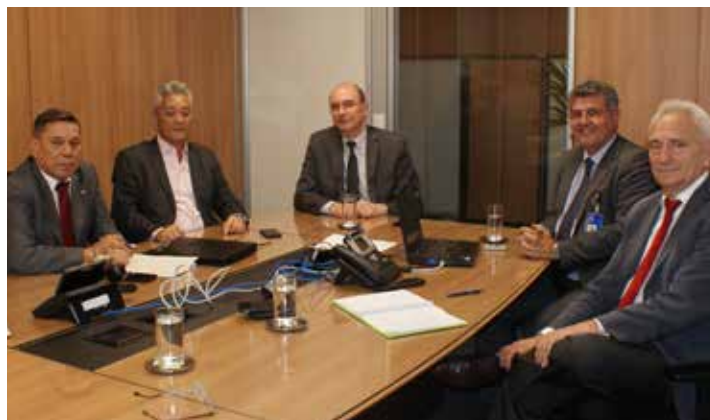
Diretoria da ANABB reunida com representantes do Banco do Brasil

Um ponto considerado negativo e crítico é o fechamento de agências, em virtude da possibilidade da perda de comissão de alguns colegas e da ansiedade no momento da realocação. A ANABB reforça que ficará atenta à movimentação dos