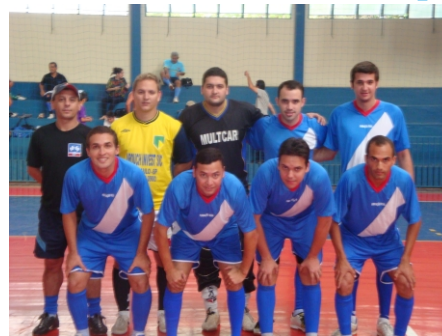
REAL - Cat. Principal