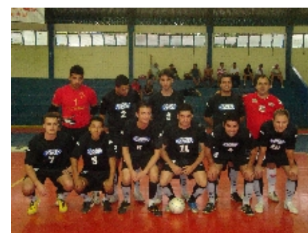
BRADESCO - Cat. Principal