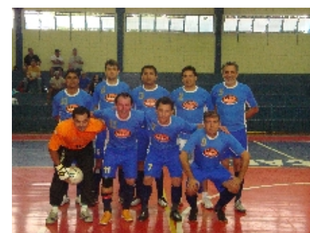
MERCANTIL - Cat. Veterano