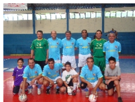
BV PAN - Cat. Veterano