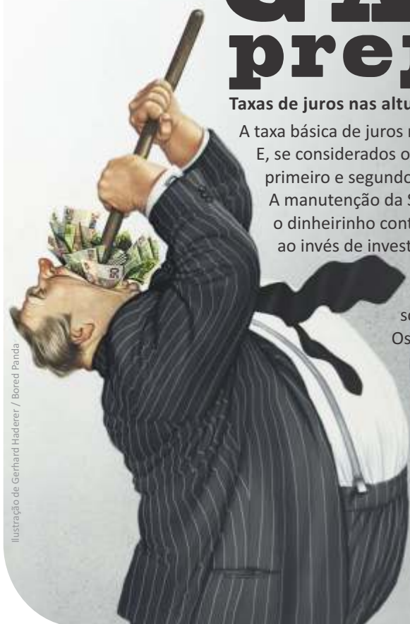
Ilustração de Gerhard Haderer / Bored Panda

Esta ganância prejudica o Brasil e o povo brasileiro.