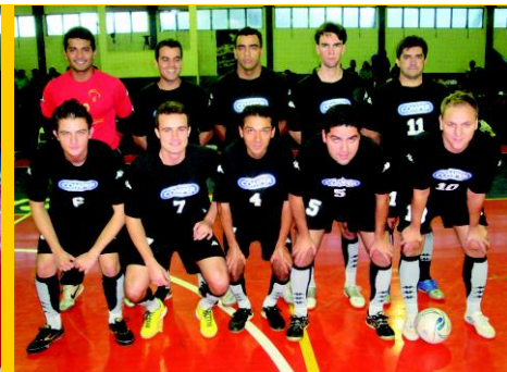
Campeão: cat. Principal - Bradesco