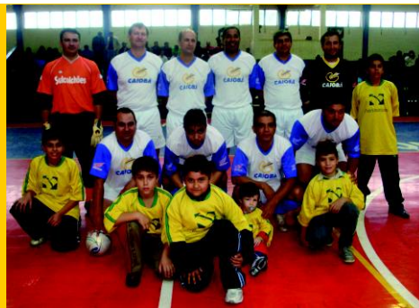
Vice-Campeão: Cat. Veterano - BV Pan