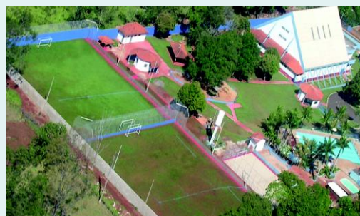
Clube de Campo