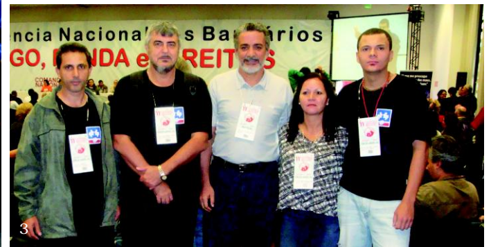
Fotos: Conferência Nacional. 1 - Presidentes dos Sindicatos dos Bancários de várias regiões do Brasil. 2 - Plenária Geral (Crédito: Júlio César Costa) 3 - Delegados de Campo Grande - MS e Região (Crédito: Seab CG/MS).

A pauta de reivindicações para a Campanha Salarial foi elaborada na Conferência Nacional e ratificada nas assembleias sindicais dos bancários. Saiba quais são as principais deliberações e como foi o processo para elaboração da minuta nas Páginas.....2 e 3