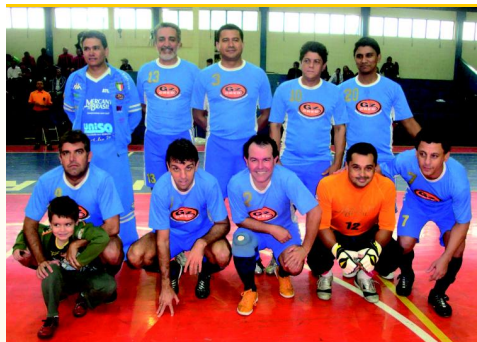
Campeão: cat. Veterano - Mercantil