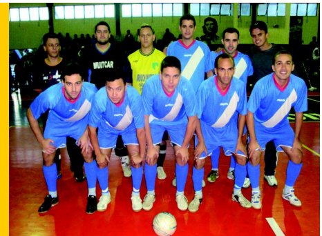
Vice-Campeão, cat. Principal - Real

No dia 14 de julho o Ginásio Poliesportivo do Clube de Campo do Seeb CG – MS e Região estava a todo vapor. Aconteceu a grande final da IV Copa de Futsal dos Bancários. Foram mais de três meses de disputas e de interação entre os bancários da capital. 13 equipes disputaram as partidas (8 - categoria principal e 5 - categoria veterano). Mas, apenas seis equipes se destacaram e chegaram à final conseguindo as três primeiras colocações: